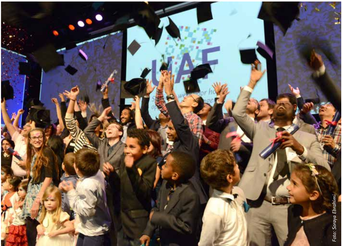
Afstudeerders en hun kinderen tijdens het afstudeerfeest 2016

Het principe dat iedereen een gelijk startpunt in het begeleidingstraject heeft laten we los. Eenmaal toegelaten kan de student rekenen op een modulair begeleidingstraject, bestaande uit een standaardcomponent die eventueel kan worden aangevuld met maatwerk. Doordat werkprocessen efficiënter zijn ingericht, is er meer tijd en aandacht voor persoonlijke begeleiding.