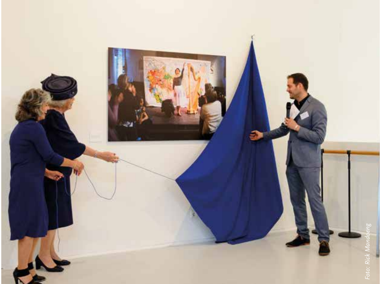
Prinses Beatrix opent fototentoonstelling 'Weer toekomst!'